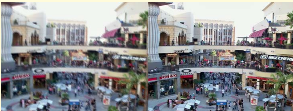
Links bewogen, rechts weer scherp gemaakt.

Adobe toonde tijdens MAX 2011, de beurs voor Adobe-ontwikkelaars, nog meer 'sneak previews'. U vindt ze hier: adobe.ly/MAX2011SP